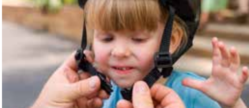
Veilige schoolomgevingen p.2