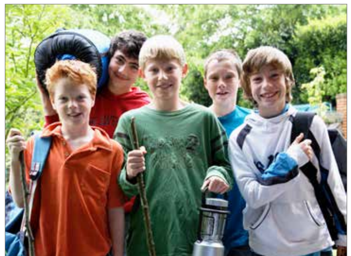
▲ Via een overlegplatform kan je nieuwe gezinnen in Kinrooi beter informeren over het vrijetijdsaanbod.