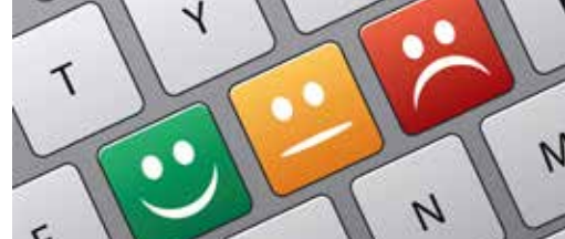
Geef jouw mening over Kinroois beleid! p.3