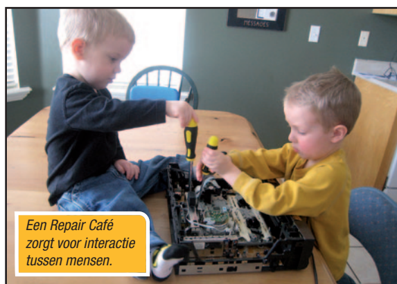
Een Repair Café zorgt voor interactie tussen mensen.

N-VA Kinrooi wil dan ook mee aan de kar trekken om dit project te realiseren. De gemeente kan hier een voortrekkers- en ondersteunende rol in spelen.