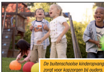
De buitenschoolse kinderopvang zorgt voor kopzorgen bij ouders.

worden in onze andere kerkdorpen de parochiezalen afgebroken. Waar moeten hun verenigingen naar toe?