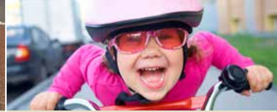
Schoolomgeving Kinrooi wordt veiliger (p. 3)