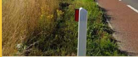
Extra wildreflectoren op Weetersteenweg (p. 2)